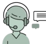
Conserje de atención médica