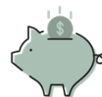
HSA / FSA Soporte